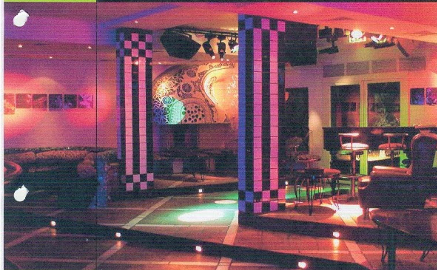
Privè Joy Smokers